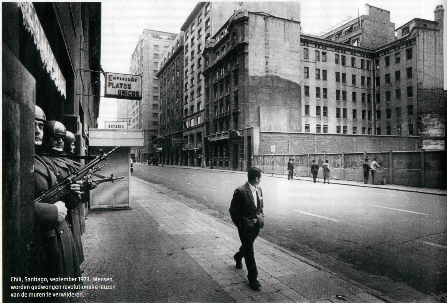
Chili, Santiago, september 1973. Mensen worden gedwongen revolutionaire leuzen van de muren te verwijderen.

door Fleur Bourgonje